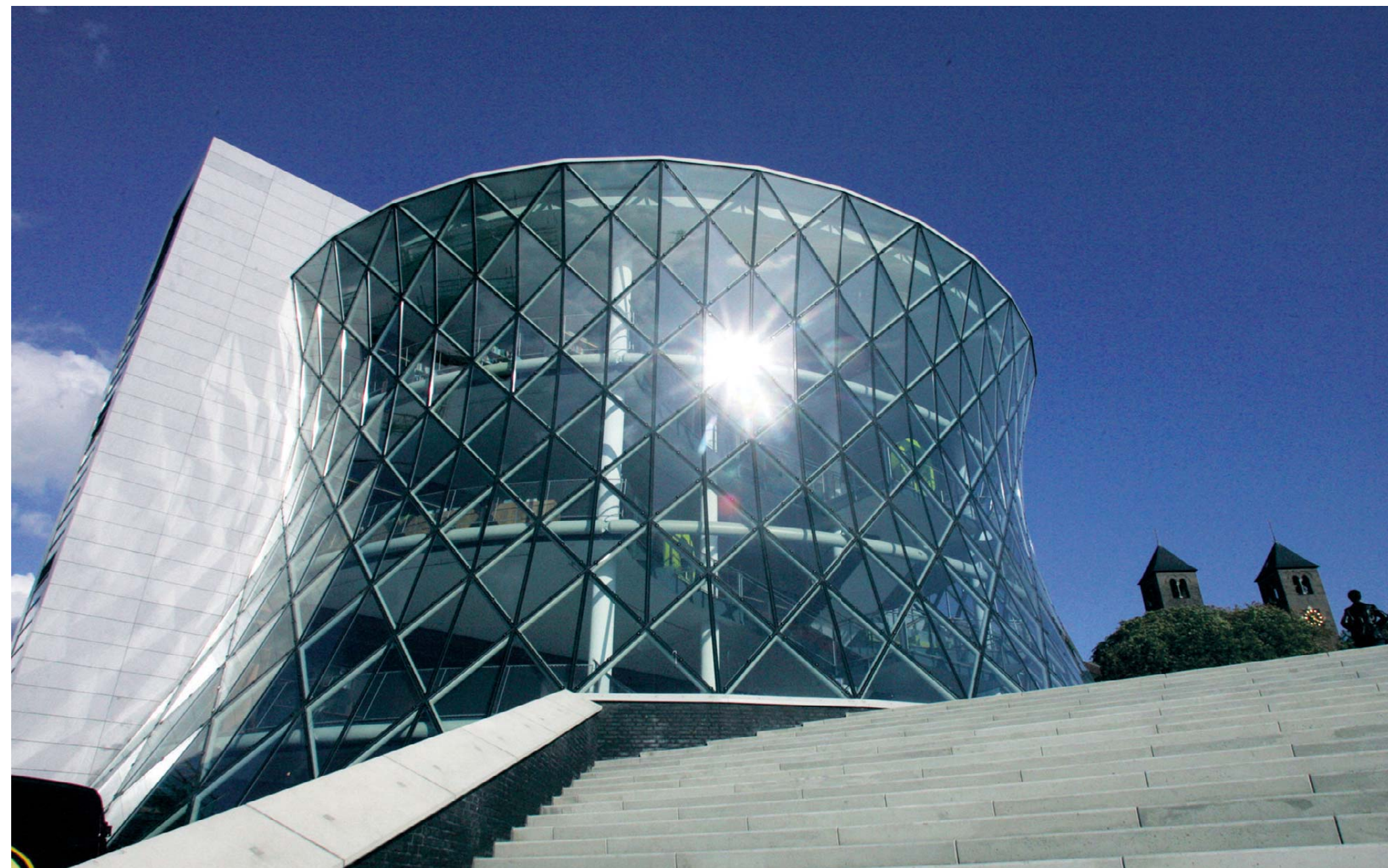
De glazen koeltoren in het hart van Heerlerheide symboliseert het Mijwaterproject waarmee Heerlen bekendheid mende tijd moet blijken of de gemeenteraad bereid is om geld in het innovatief parapadepaardje te blijven steken.