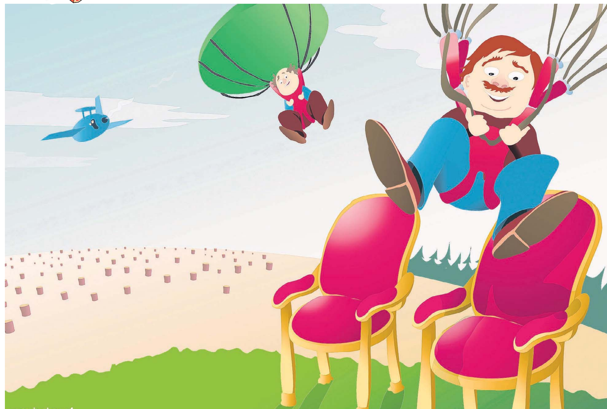
Het Awacs-dossier is van oudsher een waar mijneveld voor politici in Onderbanken.